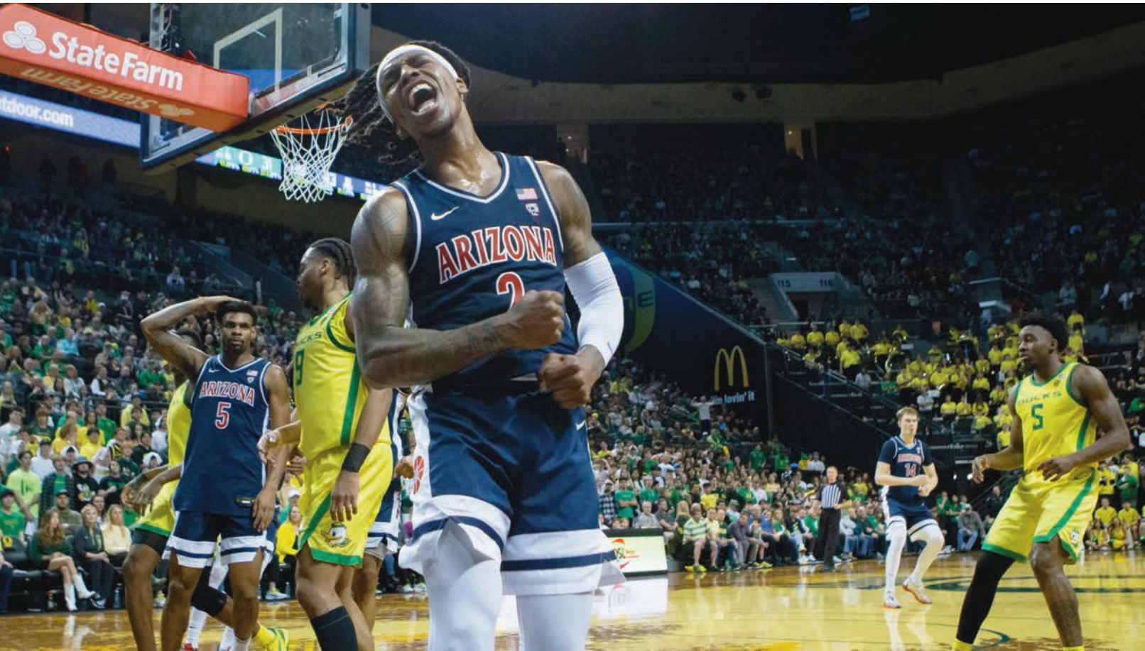
Arizona lleva cinco triunfos en fila.

TUCSON, ARIZ » Suben tres lugar en el ranking nacional, premian a Larsson