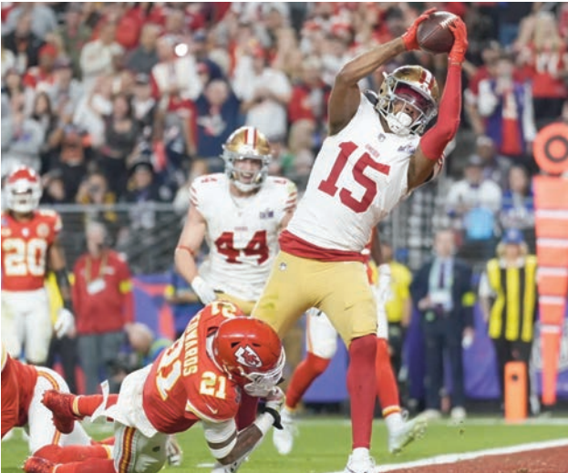
Jauan Jennings atrapa un pase de anotación en el super bowl