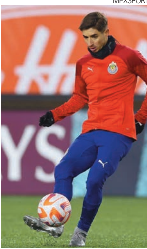
Chivas ganó 3-1 en la ida.

ta naturaleza cuando se coronó ante el Toronto FC dentro de la Concachampions. Si es que el Rebaño logra su pase a la siguiente ronda estaría puesta la mesa para que la Copa de Campeones sea testigo del Clásico Nacional, pues si Guadalajara y América avanzan en sus respectivas series, ambos tendrán que verse las caras en la siguiente instancia de este torneo.