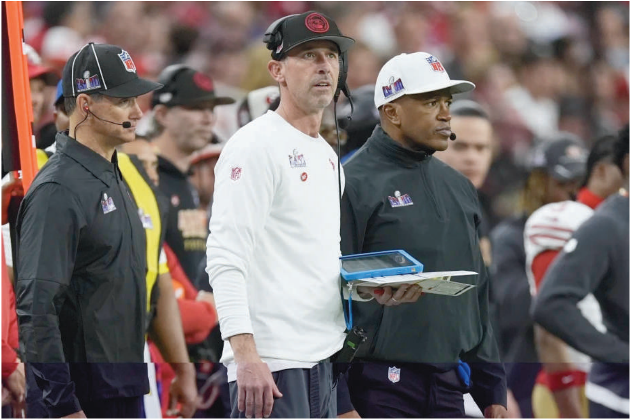
Kyle Shanahan ha perdido dos super tazones como entrenador en jefe