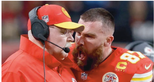
Travis Kelce reclama a Andy Reid durante el juego del domingo

Un frustrado Travis Kelce empujó a su entrenador Andy Reid en la banda, haciendo retroceder unos pasos al estratega de 65 años de los Jefes de Kansas City, después de que su compañero Isiah Pacheco soltó un balón dentro de la zona roja durante el segundo cuarto del Super Bowl el domingo.